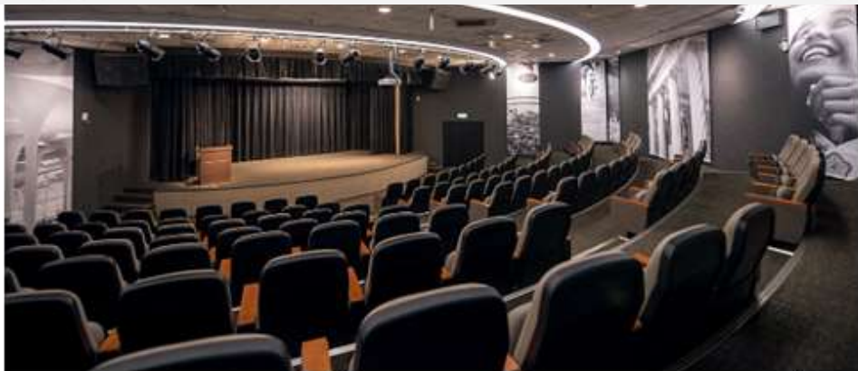
圖 1 成果發表會舉辦地點